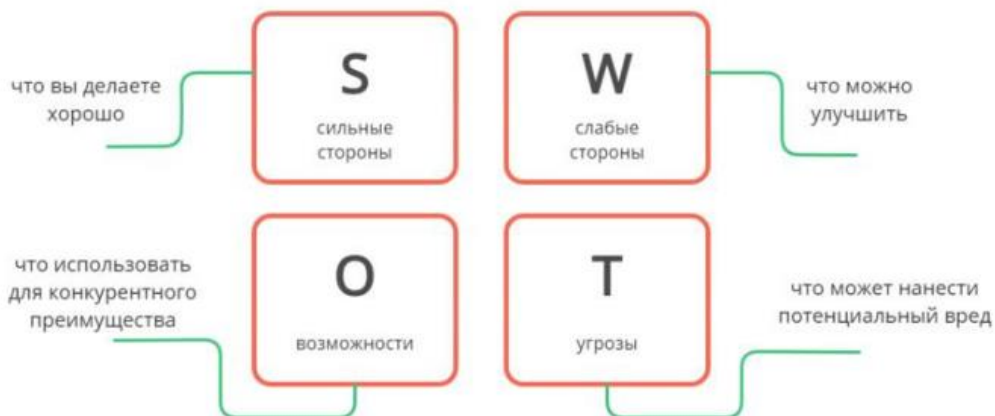
Рисунок 2 - SWOT-анализ продукта и компании

Если организация планирует выходить на объёмный рынок и впоследствии получить существенную его долю, необходимо открывать отдел маркетинга и нанимать специалистов, чтобы работа над стратегией реализации продукции велась на постоянной основе.