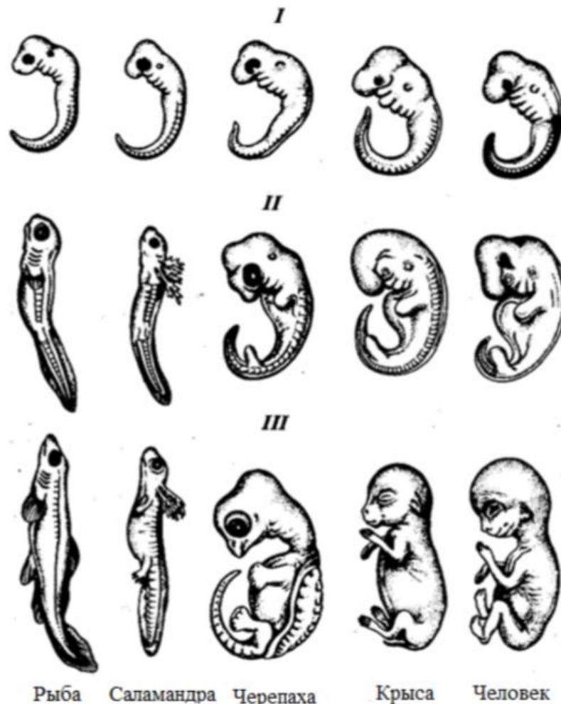
Рисунок 3.1 – Эмбриональное развитие позвоночных животных

Задание 3. Заполнить таблицу 3.1, учитывая стадию развития.