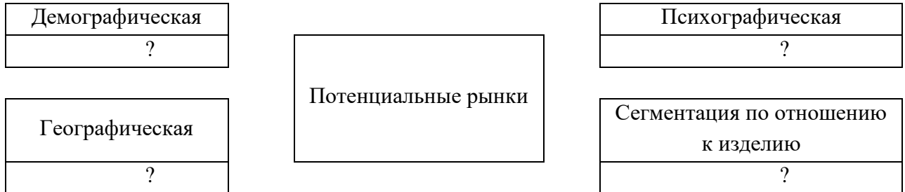
Рисунок - Схема сегментации рынка

Размер семьи. Степень нуждаемости в продукте. Плотность населения. Профессия. Численность населения. Климат. Поиск выгод при покупке изделия.