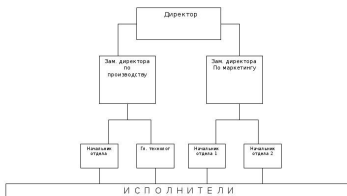
Рис. 2. Линейная структура управления проектом