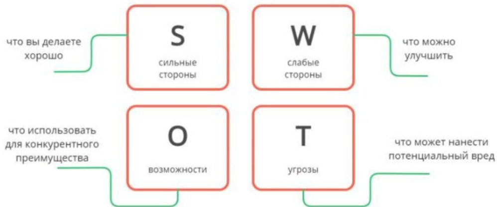
Рисунок 2 - SWOT-анализ продукта и компании

Если организация планирует выходить на объёмный рынок и впоследствии получить существенную его долю, необходимо открывать отдел маркетинга и нанимать специалистов, чтобы работа над стратегией реализации продукции велась на постоянной основе.