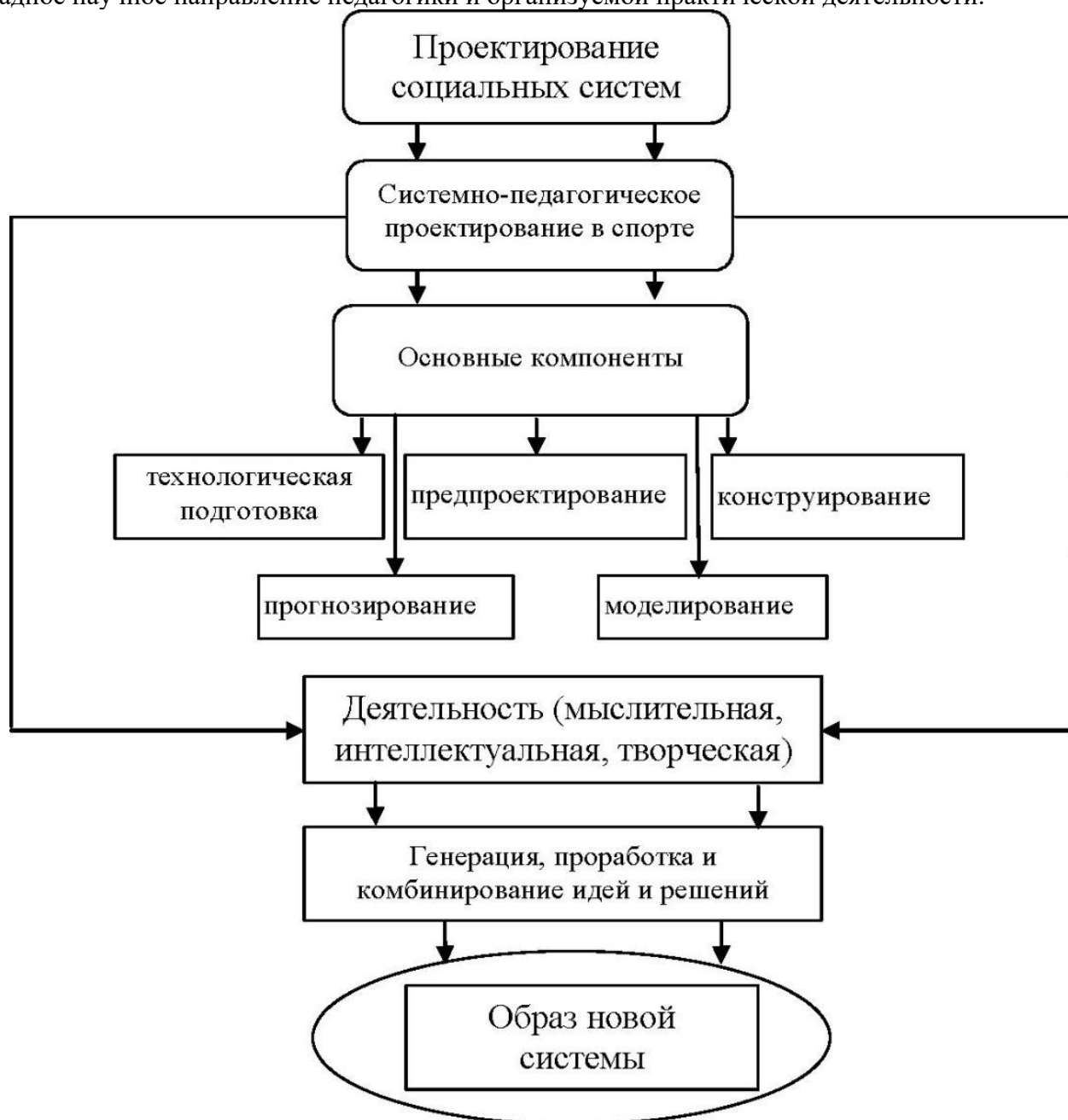
Рис. 1 Системно-педагогическое проектирование

Таким образом, педагогическое проектирование можно определить, как прикладное научное направление педагогики и организуемой практической деятельности.