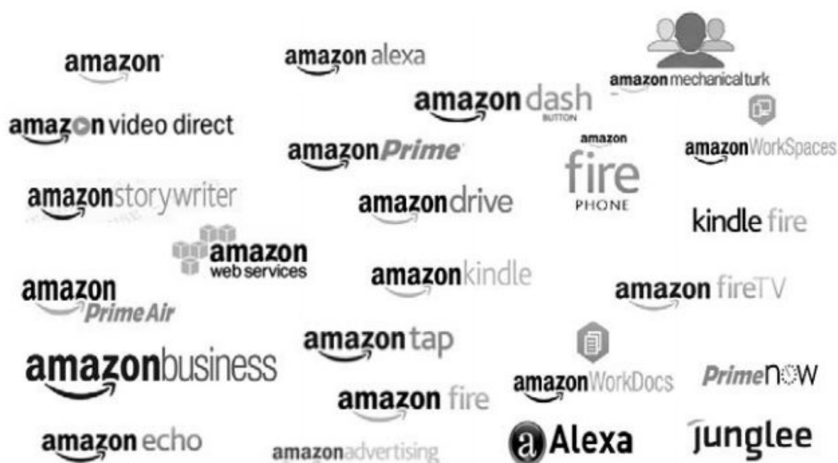
Рис. 2. Схема устройства Fulfillment By Amazon в Европе (составлено авторами на основе информации на веб-сайте Amazon.com)

Помимо этого в европейских странах, где Amazon имеет дочерние предприятия, функционируют локальные склады: они применяют как схему FBM, так и FBA, только во втором случае на складе аккумулируются только товары сторонних поставщиков конкретной страны, и, конечно, товары Amazon. Таким образом, сторонние поставщики, реализующие продукцию через платформу Amazon, вправе выбрать, где осуществлять хранение.