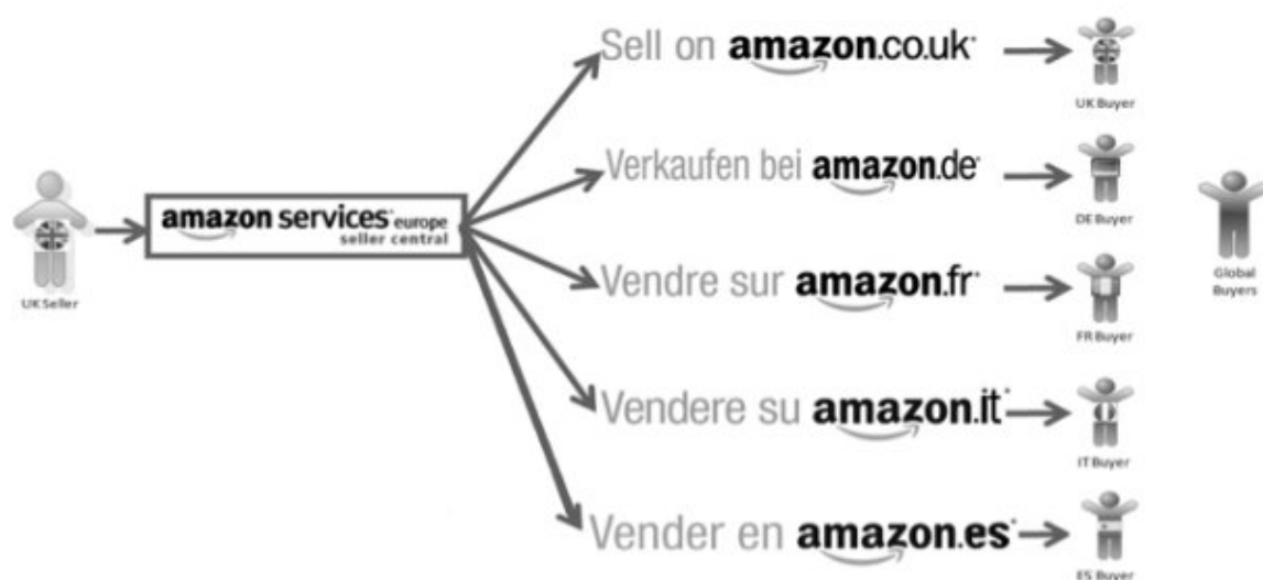
Рис. 3. Перечень брендов продуктов и сервисов Amazon (составлено авторами на основе информации на веб-сайте Amazon.com)

цене и доставка в максимально короткие сроки. Отдельно была создана компания Amazon Web Services, изначально предназначенная только для поддержки высокоскоростной работы системы по всему миру, поскольку Amazon подсчитала, что задержка в работе сайта на 1 секунду стоит компании миллионов долларов недополученной прибыли. Помимо этого, для компании крайне важно предложить клиенту широкий выбор товаров на сайте, а также учесть специфику предпочтений клиента в зависимости от региона.