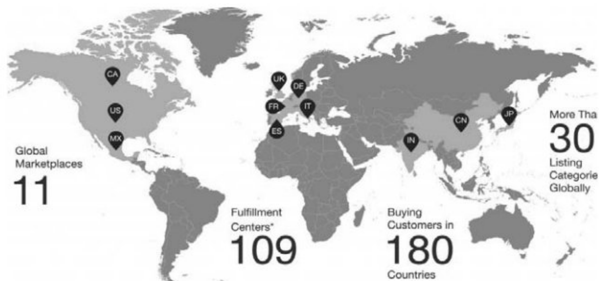
Рис. 1. География распространения Amazon

На сайте Amazon представлены как товары самой компании, так и множества сторонних поставщиков, которых она активно привлекает для продаж через свою онлайн платформу. В настоящее время около половины всех товаров на Amazon продается сторонними поставщиками 1 .