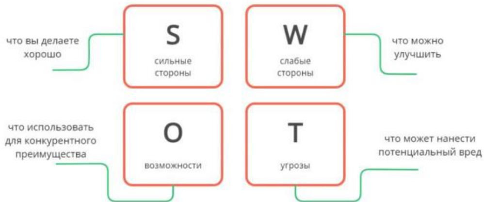
Рисунок 2 - SWOT-анализ продукта и компании

Если организация планирует выходить на объёмный рынок и впоследствии получить существенную его долю, необходимо открывать отдел маркетинга и нанимать специалистов, чтобы работа над стратегией реализации продукции велась на постоянной основе.