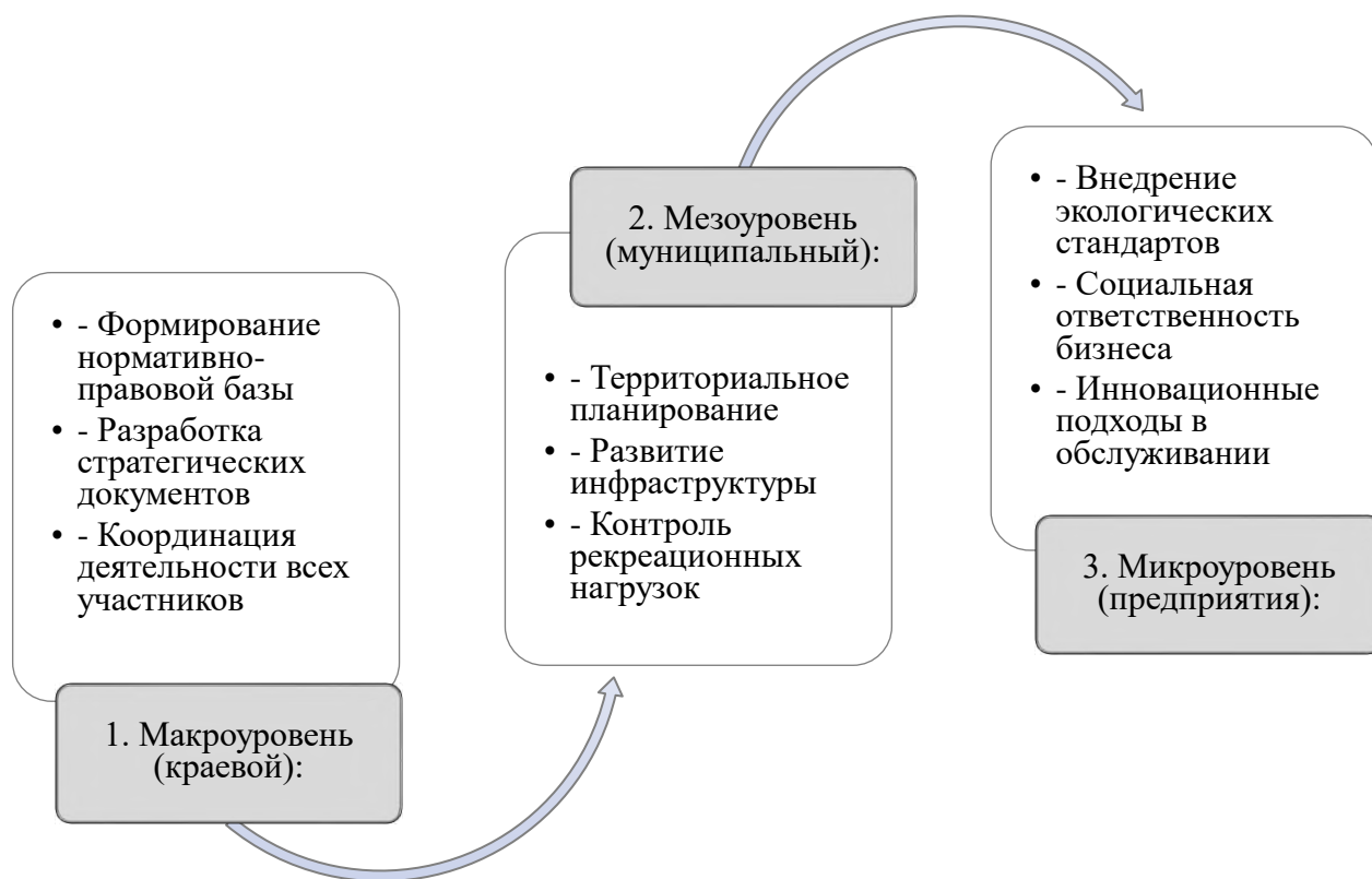
Рисунок 10 – Модель устойчивого развития туризма

На основе проведенного анализа предложена трехуровневая модель устойчивого развития (рисунок 10).