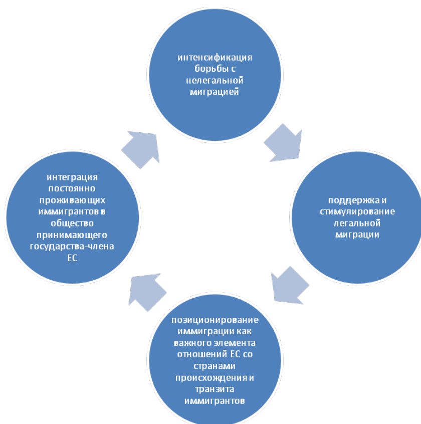
Схема 5. Структурные элементы современной миграционной политики ЕС.

Сегодня для ЕС актуальны два уровня проблем: поиск путей оптимизации регулирования миграционных потоков и формирование общей стратегии интеграции в местную среду мигрантов. Интеграционная политика - это система законодательных мер и практических механизмов, которые регулируют процессы включения иммигрантов в принимающее общество, в соответствии с экономическими, демографическими, геополитическими, социальными и культурными целями данного общества. Программно-целевой метод урегулирования конфликтных ситуаций в ЕС базируется на разработке стратегий реализации миграционной политики. Рассмотрим структуру интеграционной политики в ЕС (схема 6).