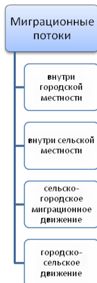
Схема 2: Направления миграционных внутритерриториальных потоков

Более того один вид миграции может трансформироваться в другой или выступать его составной частью.