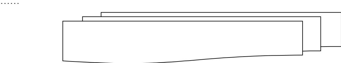
Рисунок 1 – Типы организационный культуры

Цифровой материал оформляется в виде таблиц , которые нумеруются последовательно арабскими цифрами сквозной нумерацией. Допускается нумеровать таблицы в пределах раздела. Название следует помещать над таблицей симметрично текста (по центру). На все таблицы должны быть приведены ссылки в тексте пояснительной записки, при ссылке следует писать: «... в соответствии с таблицей 2» при сквозной нумерации, «... в соответствии с таблицей 1.2» при нумерации в пределах раздела и «... может быть представлено следующим образом (таблица 3)». Таблицу следует обособить от текста сверху и снизу одним интервалом (полуторный).